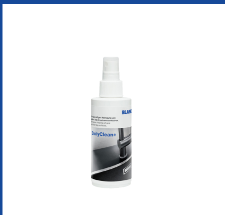
DailyClean+ 150 ml. BC-T526618

NB! Undgå konstant påvirkning af kogende vand på samme sted på vaskens overflade i længere tid. Bruges den kogende hane til skoldning eller rengøring anbefales det at sætte en gryde eller lignende i bunden af vasken!