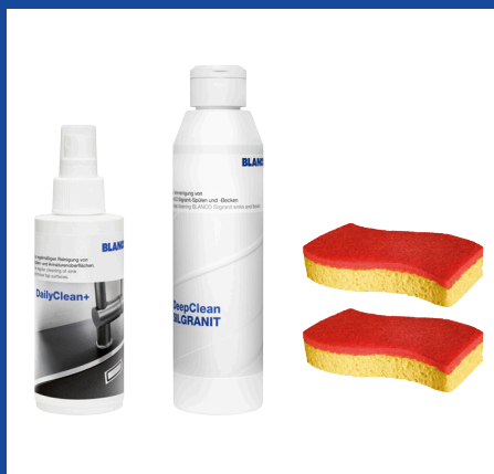
Silgranit Cleaning Set BC-T527033